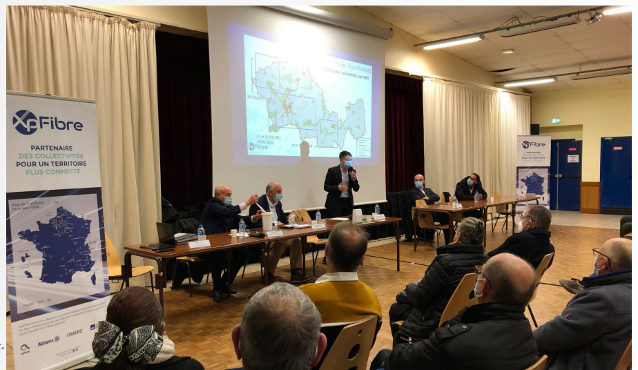
La réunion publique organisée le 2 décembre 2021 à Cloyes-les-Trois-Rivières, en secteur AMEL.

Non, ils ne doivent pas hésiter à organiser de telles rencontres. Même dans les conditions actuelles de pandémie. J'avais annoncé que le masque et le passe sanitaire seraient obligatoires. Cela n'a pas empêché les gens de se déplacer.